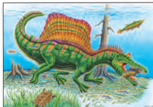
大判リーフレット 252mm×364mm