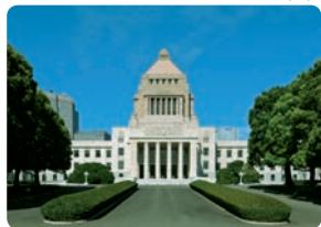
こっかいぎじどう 国会議事堂